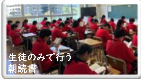
生徒のみで行う朝読書

そして、二南中は5月に運動会、10月に文化発表会の二大行事が行われます。生徒全員が本番に向けてどの行事も全力で練習をするので、クラス内の団結力が見られ、充実した行事になります。